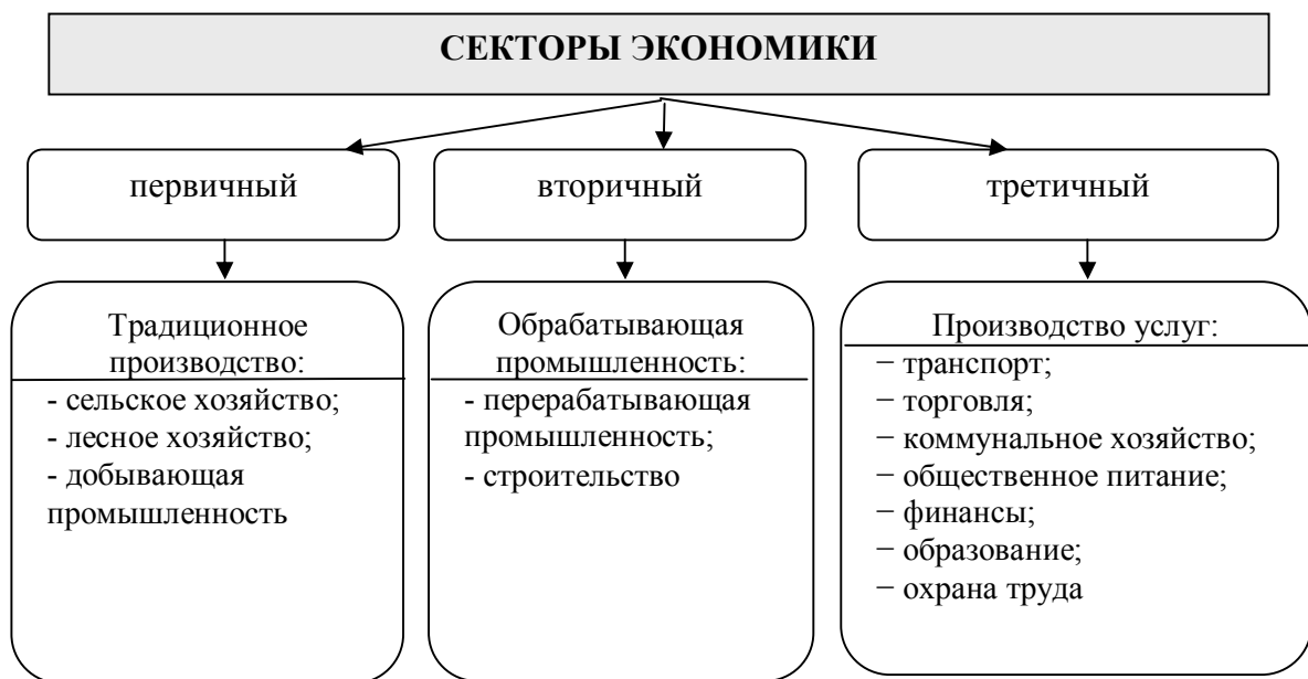
Рисунок 1 – Модель структуры экономики Фишера-Кларка

Одна из первых моделей структуры экономики была разработана в 30-х годах XX ст. новозеландским экономистом А.Фишером и английским экономистом и статистиком К. Кларком, которые предложили теоретическую концепцию трех секторов. Согласно этой концепции, с развитием экономики происходит процесс последовательной смены ролей трех основных ее секторов: первичного, вторичного и третичного. Критериями разделения экономики на секторы является технико-экономические особенности отраслей, их зависимость от природных факторов и взаимосвязь с производством благ. Таким образом, согласно модели структуры экономики Фишера-Кларка (рис. 1), в состав первичного сектора входят виды экономической деятельности, которые осуществляют производство сырья, вторичного – виды деятельности, в которых происходит переработка сырья в конечную продукцию, третичного сектора – те виды деятельности, которые предоставляют услуги первым двум.