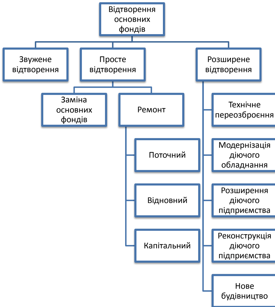
Рисунок 2 – Типи та форми відтворення основних фондів

Форми відновлення основних фондів відрізняються між собою розмірами необхідного фінансування та отриманими результатами від їх проведення: звужене відтворення передбачає зменшення загальної сукупності основних фондів, просте відтворення – збереження споживчих вартостей основних фондів (відновлюється попередня виробнича потужність), а розширене відтворення – збільшення споживчих вартостей основних фондів, їх загальної кількості та якості, що забезпечує вищий рівень продуктивності обладнання.