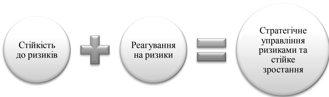
Рис. 1. Значення ризикостійкості та реагування на ризики в діяльності підприємства

2. Формування ризикостійкості, яка дозволить даними системам пом'якшувати події ризику і забезпечить просування бізнесу до поставлених цілей.