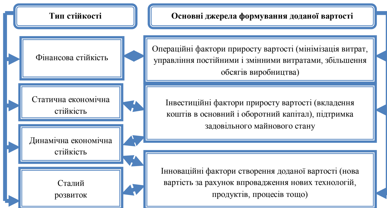
Рис. 2. Співвідношення видів економічної стійкості підприємства та основних джерел формування доданої вартості

Підприємству як і будь-якій складній відкритій системі можуть бути притаманні декілька видів стійкості, серед яких в економічній теорії виділяють наступні: видима стійкість 1-го і 2-го роду, групова стійкість, адаптивна стійкість та відкладена стійкість. Видима стійкість (або псевдостійкість) системи спостерігається у тому випадку, коли більшість показників системи зберігають стійкість, проте це відбувається внаслідок незмінності зовнішнього середовища. При зміні умов функціонування система або припинить існування (видима стійкість 1-го роду) або її стійкість буде порушена (видима стійкість 2-го роду).