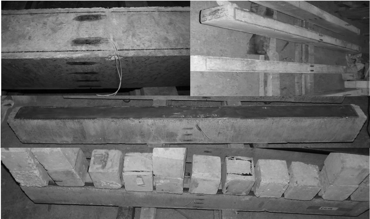
Рис. 1. Технологія влаштування клейового з'єднання зразка Б3

знімалися за допомогою приладу "ВНП-8". Вертикальні переміщення згинальних зразків у процесі навантаження фіксувалися за допомогою прогиноміра ПАО-6, який установлювався по середині прольоту.