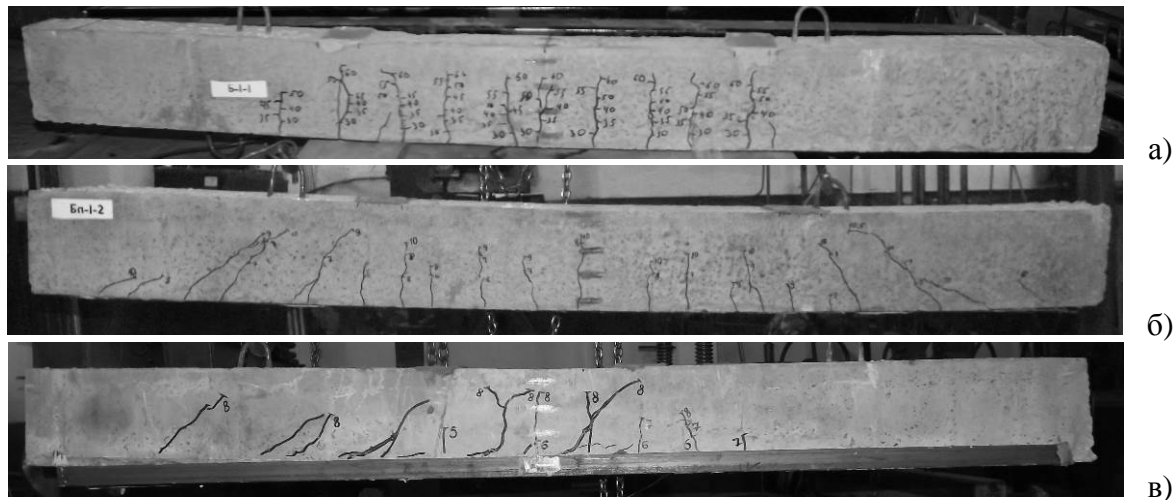
Рис. 4. Зразки після руйнування: а) Б1; б) Б2; в) Б3

бетоном і сталлю (по бетону). Отже, для забезпечення сумісної роботи бетону й сталі в процесі підсилення залізобетонних конструкцій раціональніше використовувати акрилові клеї, уникаючи використання анкерних засобів, закладних деталей та обойм.