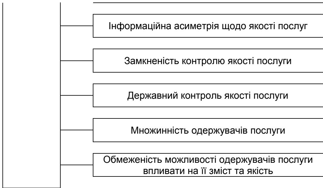
Рис. 3. Характеристика діяльності ВНЗ як економічного агента

Освітні послуги, які надає ВНЗ як економічний агент, мають масовий характер, тобто у системі вищої освіти України студенти однієї спеціальності навчаються за типовими програмами й отримують однакові знання. Попри спроби індивідуалізації роботи із студентом, характер освітніх послуг залишається масовим, тобто недостатньо пристосованим під потреби індивідуального замовника таких послуг.