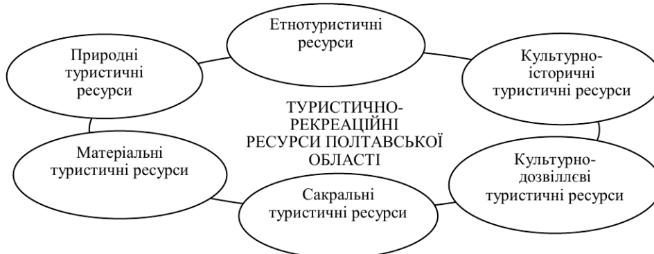
Рис. 1. Туристичні ресурси Полтавської області [систематизовано та вдосконалено автором]

Проаналізуємо основні туристично-рекреаційні ресурси Полтавської області (рис. 1), які визначають передумови та можливості розвитку туристичної галузі.