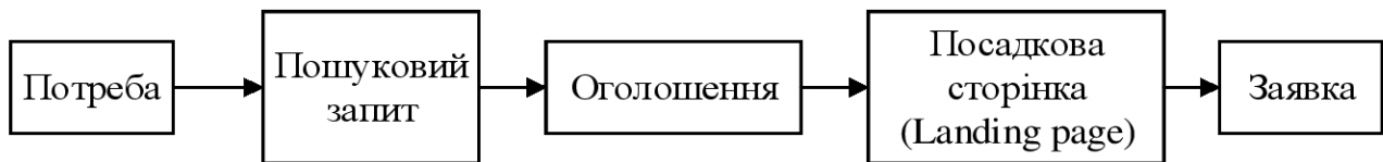
Рис.2. Шлях потенційного споживача товару від формування запиту до оформлення заявки

За визначеною потребою потенційний споживач товару вводить запит у пошуковій системі і знаходить ряд пропозицій (оголошень). Через добірку рекламних оголошень здійснюється перехід на тематичну web-сторінку, а саме на цільову сторінку (landing page), на якій здійснюється замовлення необхідного товару рис 2.