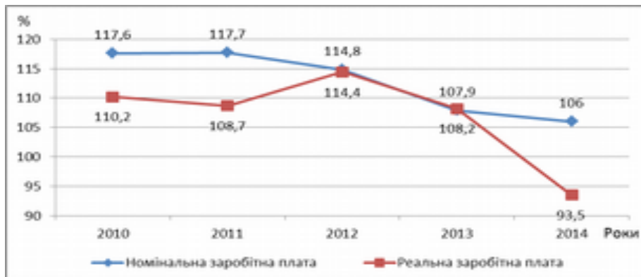
Рис. 2. Динаміка індексів реальної і номінальної заробітної плати найманих працівників в Україні у 2010 – 2014 рр.

Про це також свідчить індекс реальної заробітної плати (рис. 2), розмір якого з кожним роком зменшується, і у 2014 році становив 93,5%. Зменшення розміру реальної заробітної плати зумовлено складною економічною ситуацією, політичною нестабільністю, воєнними діями на сході України, а також інфляційними процесами в державі та знеціненням національної валюти.