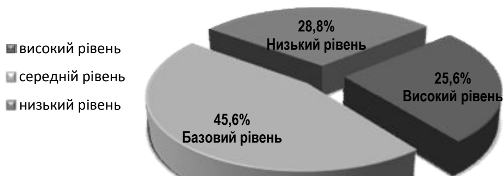
Діаграма 2 Рівень сформованості загальнокультурної компе

Аналіз отриманих результатів уможливорює висновок про те, що під час професійної підготовки майбутніх документознавців формуванню загальнокультурної компетентності як складника їх комунікативної компетентності приділяється недостатня увага.