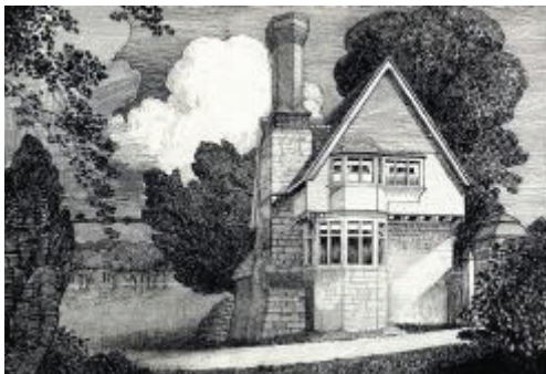
Рисунок 1. Робота виконана тушшю, 1860

Одним із найдавніших художніх матеріалів відомих людству є туш. Її історія починається у період Давнього Єгипту та Давнього Китаю. Згідно із всесвітньо визнаною версією винахідником туші є китайський філософ Тієн-Лшеу, який використовував її для письма. Сталося це близько 2700 року до н.е.