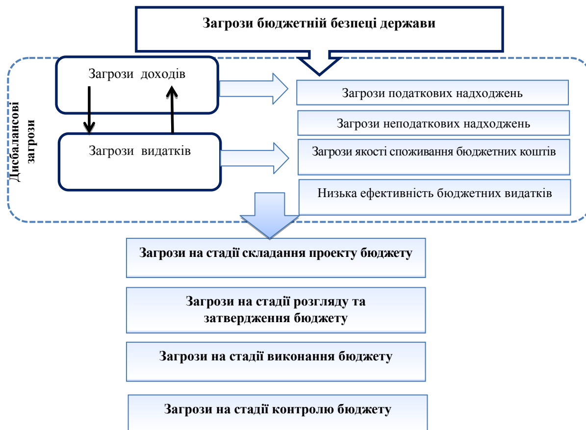
Рис. 1. Класифікація загроз бюджетній безпеці України

Зміст загрози безпеці визначається багатьма ознаками та чинниками, тому нам потрібно розмежувати класифікаційні ознаки загроз економічній безпеці, що дасть змогу визначити вид цих загроз та чинники, які впливають на зміну граничного значення результативного показника. Узагальнюючи пропонувані різними авторами групи негативних впливів, а також урахувавши сучасний стан організації бюджетних відносин та особливості реалізації бюджетної політики, автором запропоновано класифікацію загроз бюджетній безпеці України (рис. 1).