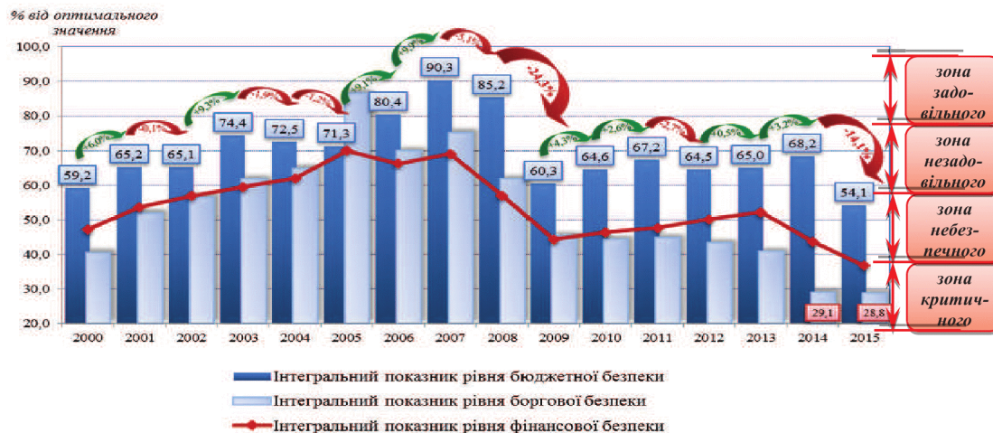
Рис. 1. Динаміка субіндексів складників фінансової безпеки України протягом 2000–2015 рр.*

надходжень від основних бюджетноутворювальних податків за посилення фіскального тиску на економіку, різкою девальвацією національної валюти, значним зростанням державного та гарантованого державою боргу з посиленням ризиків настання дефолту, неліквідності й неплатоспроможності фінансових установ, скороченням ресурсної бази банків, проблемами з їх капіталізацією. Це визначило критичний і близький до критичного стан майже всіх складників фінансової безпеки (рис. 1).