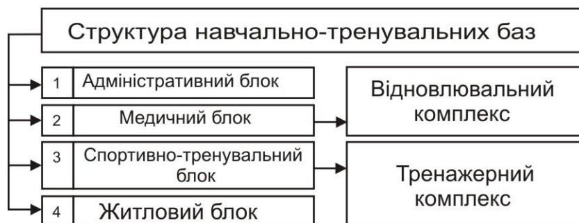
Рисунок 1 – Схема функціональної структури типової НТБ в Україні.

Спільним для всіх типів НТБ є наявність таких функціональних блоків: адміністративного, медичного, житлового, допоміжного, відновлювального (включає фізіотерапевтичний комплекс, відділення трансфузіології та еферентної терапії, SPA-блок, рис.1 і 2).