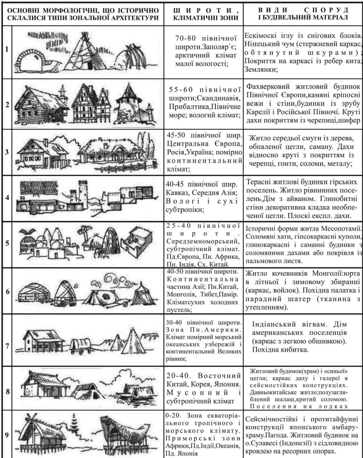
Рис. 1. Особливості історичної народної архітектури в залежності від клімату.

Виклад основного матеріалу. З появою перших ознак цивілізації людям доводилося зніматися з обжитих місць під час змін клімату, і цілі племена і народи, гнані холодом чи спекою, переміщалися на нові землі. Навіть там, де клімат і природні умови були цілком задовільні, людина від простих укриттів на зразок печери або дерева переходить до спорудження житла, вид і образ якого визначається комфортними потребами, доступною формою господарської діяльності, а також наявними місцевими будівельними матеріалами.