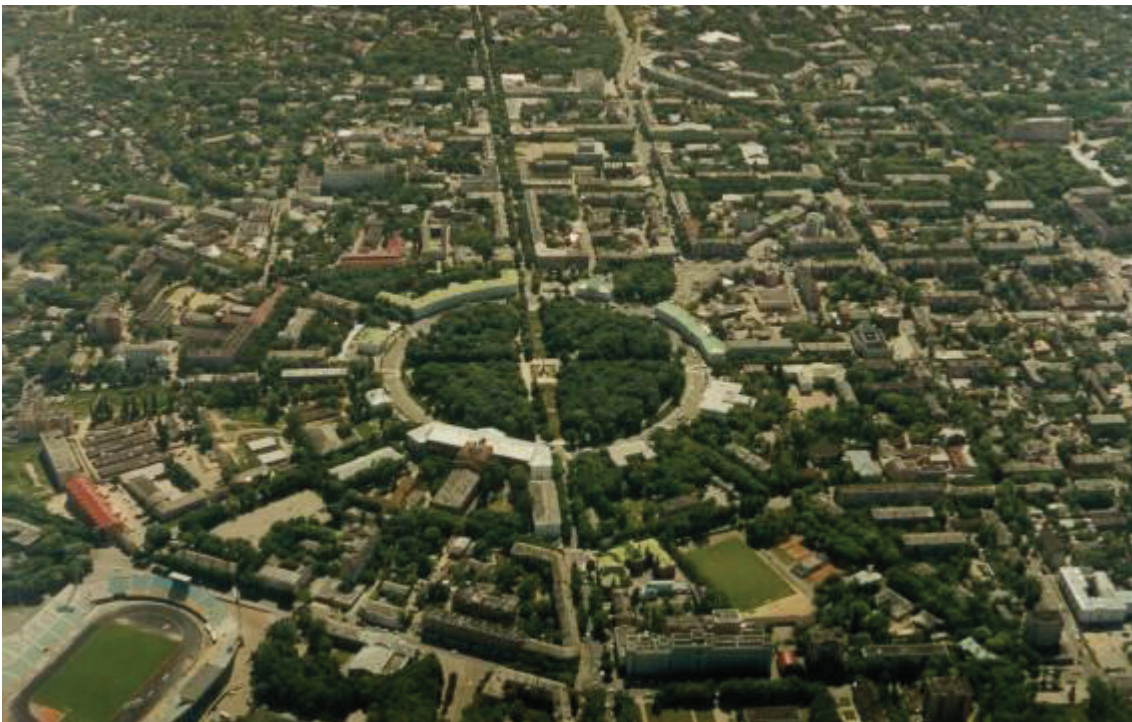
Рис. 1. Кругла площа з висоти пташиного польоту

Просторово-часова композиція міста (ансамблю) включає організацію ритмічного ряду просторів в напрямку шляху руху до домінуючого елементу. Ритмічний ряд складається з серії вже відзначалися просторових акцентів (напруг) і пауз (дозволів). Акцентами виступають граничні простору між двома просторами-опозиціями: внутрішнім і зовнішнім, світлим і темним, крупно-і дрібномасштабним, просторами різних структурних рівнів тощо. Паузи є рівномірні незмінні простору. Акценти можуть фіксувати також і переломи в напрямку руху. Ритм змінюваних видових картин, зміна просторово-світлових вражень створює єдиний сюжет просторово-часової композиції в архітектурному сюжеті [2, с.94].