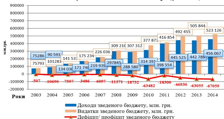
Рис.1. Співвідношення динаміки доходів, видатків та дефіциту зведеного бюджету України за 2003 – 2014 рр., млн. грн. [1; 2].

Рівень бюджетного дефіциту належить до найважливіших індикаторів бюджетної безпеки кожної держави. Протягом останніх років, перевищення межі дефіциту як державного, так і зведеного бюджету відповідно до Маастрихтського договору в Україні зафіксовано в 2004, 2010 рр. та протягом 2012–2014 рр., що свідчить про неефективне формування зведеного бюджету та недосконалу фіскальну політику, внаслідок якої досить велика частина реального сектору економіки перебуває в тіні, тому недоотримуються кошти до державного бюджету (рис. 1).