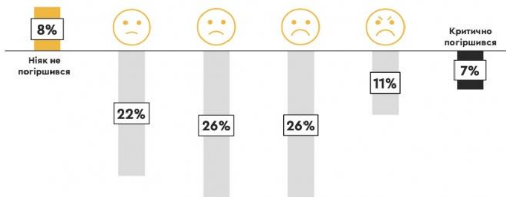
Рис. 1 Зміна фінансового стану роздрібних інвесторів рід впливом війни