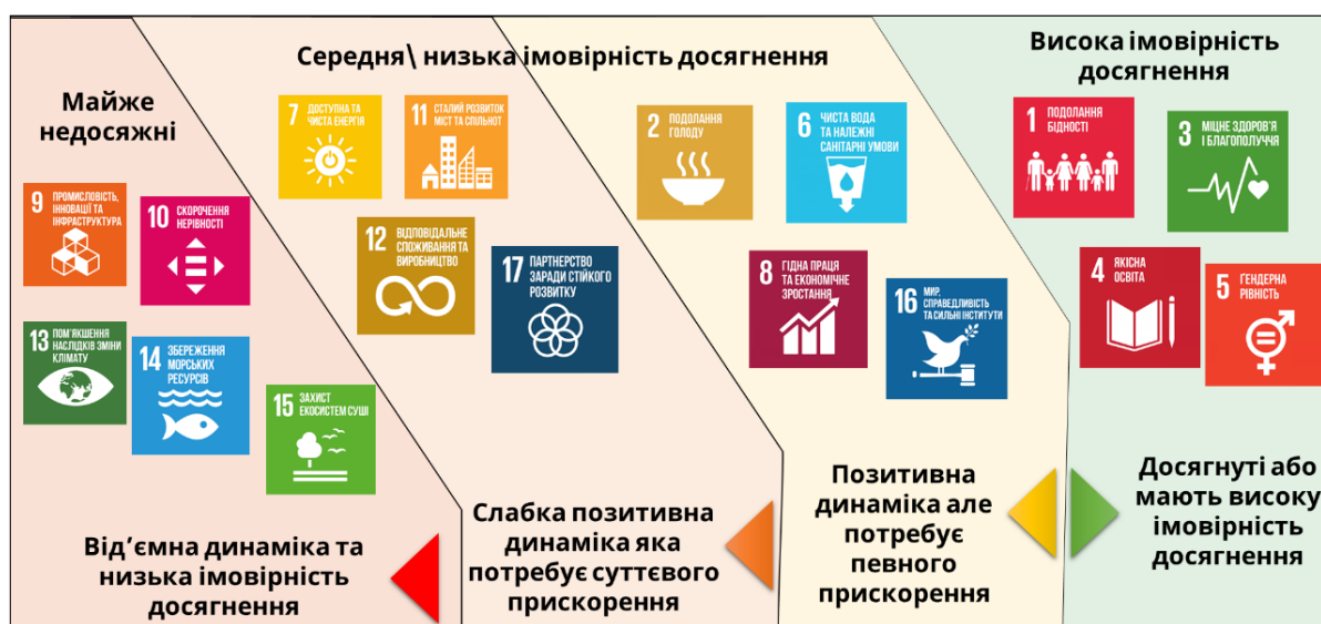
Рис. 1. Результати моніторингова звіту «Цілі сталого розвитку: Україна – 2020 рік» у розрізі можливості досяжності цілей

При складанні моніторингового звіту досягнення цілей сталого розвитку у 2020 році передбачались цілі, які можна було досягти однак після початку світової пандемії економіка країни вже вимагала