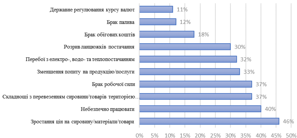
Рис. 1. Головні проблеми МСБ в Україні у вересні 2023 р.

Розвиток малого та середнього підприємництва (МСП) відіграє ключову роль в економіці України, забезпечуючи близько 64% доданої вартості, 81,5% зайнятих працівників у суб'єктів господарювання та 37% податкових надходжень [1]. Проте протягом останніх років МСП в Україні розвивається у досить складних умовах, що супроводжуються війною, коронакризою, демографічною кризою, зростаючою інфляцією, загальною політико-економічною нестабільністю. Воєнна ситуація внесла зміни в усі сфери діяльності МСП: фінансову, виробничу, логістичну, комунікаційну, інформаційну, інноваційну, іміджеву. За результатами дослідження [2], у рамках якого було опитано представників МСП в Україні, визначено найактуальніші їх проблеми (рис. 1).