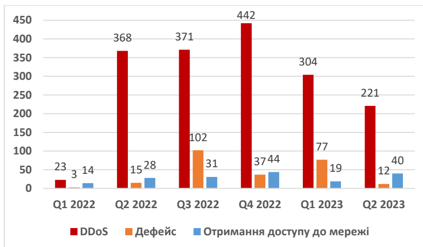
Рис. 2. Кількість кіберінцидентів з боку IP-адресів росії

Однією з найбільших загроз фінансовій системі України були і залишаються кібератаки з боку ворога, які можуть спричинити втрату конфіденційної інформації, фінансових активів та порушити функціонування фінансових установ. Порівняно з 2021 роком, кількість кіберінцидентів за 2022 рік зросло майже у 3 рази. Також слід додати, що за географією детектувань критичних подій інформаційної системи на 26% зросла кількість критичних подій, джерелом яких є IP-адреси росії. Під час війни, статистика по кількості кіберінцидентів з боку рф наведена нижче (рис. 2) [3].