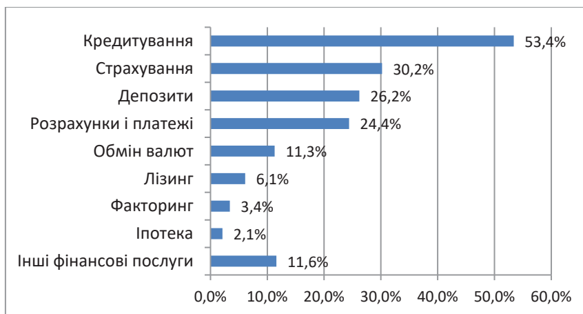
Рис. 1. Частка респондентів, які назвали певні види фінансових послуг, за результатами опитування старшокласників м. Полтава

Звертає на себе увагу суттєва перевага кредитування над іншими фінансовими послугами, що може бути пояснено агресивною рекламою насамперед, споживчого кредитування у засобах масової інформації, внаслідок чого ця послуга завжди «на слуху». Показово, що лише третина респондентів зазначила страхування, хоча, одночасно, 44,2% з них повідомили, що в їхніх родинах користуються одним або навіть декількома видами страхування. Це ще раз підтверджує нестачу у старшокласників системного розуміння організації ринків фінансових послуг.