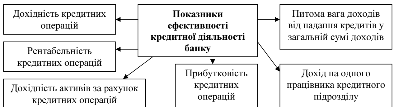
Рис. 2 Показники ефективності кредитної діяльності банку [13]

Ефективність кредитної діяльності банківської установи на даному етапі розвитку банківського сектору держави за загальним правилом аналізується компетентними підрозділами за допомогою системи показників, відображених на рис. 2: