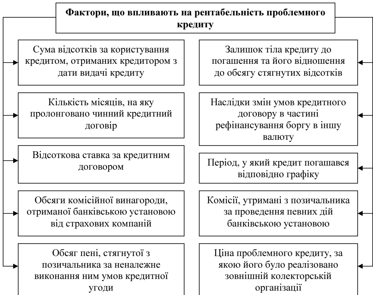
Рис. 3 Фактори, що впливають на рентабельність проблемного кредитного договору

Зауважимо, що крім банківських продуктів, що можуть призвести до збільшення рентабельності проблемних кредитів, варто враховувати також і процедуру продажу боргу третій особі.