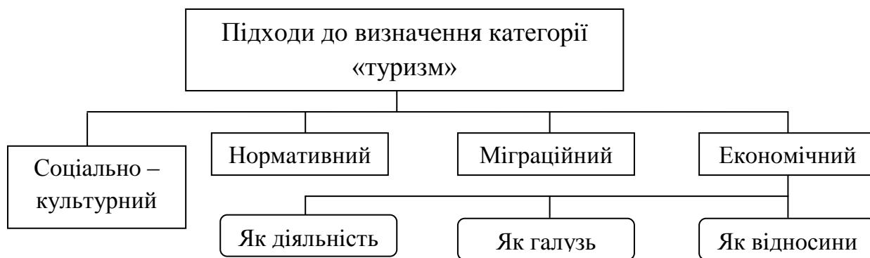
Рис.1.1 – Підходи до визначення категорії «туризм» (розроблено автором на основі [14; 15; 20])

Туризм як складне соціально-економічне явище характеризується наявністю великої кількості визначень, що постійно змінюються та вдосконалюються. Проаналізувавши та врахувавши сучасний рівень дослідження даного поняття, на нашу думку, слід виділити наступні чотири підходи до визначення даної категорії: соціально-культурний (функціональний), нормативний, міграційний та економічний (Рис. 1.1).