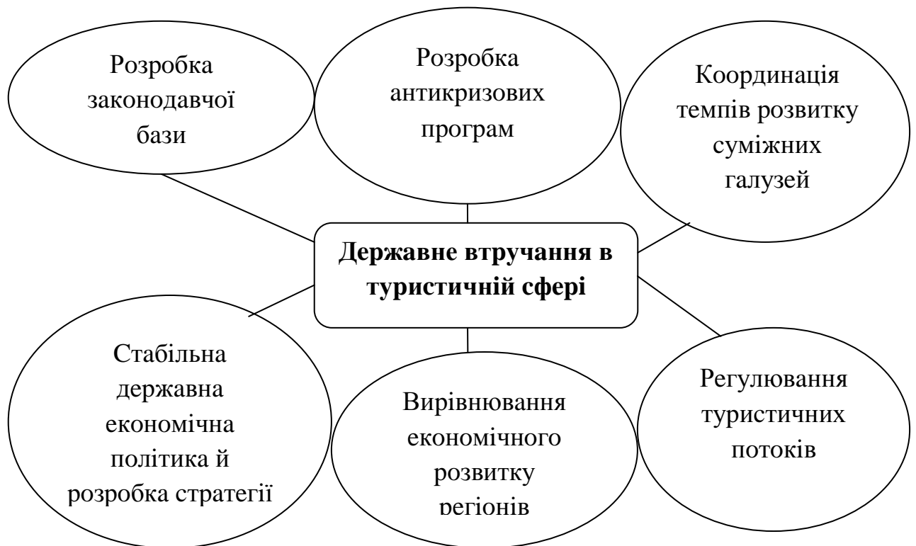
Рис.1.3 – Основні важелі державного втручання (розроблено автором на основі [31; 32])

Основні важелі державного втручання представлені на рисунку 1.3.