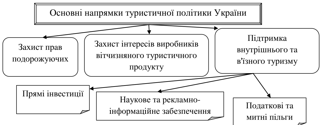
Рис.3.1 – Головні напрямки механізму регіонального управління туризмом (розроблено автором на основі [4])

Державна туристична політика базується на відповідних стратегіях і тактиках. Туристична стратегія полягає у розробці загальної концепції розвитку та цільових програм, які потребують значного часу та значних фінансових ресурсів. Завдання полягає в узгодженні, гармонізації інтересів окремої