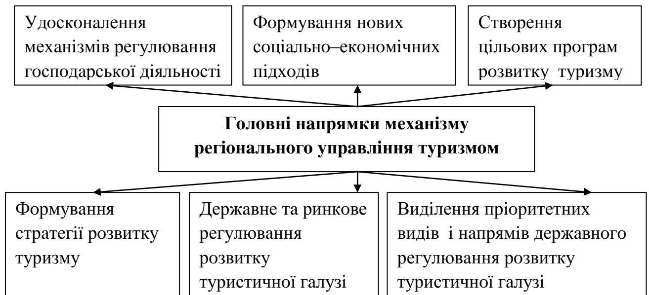
Рис.1.2 – Головні напрямки механізму регіонального управління туризмом (розроблено автором на основі [31; 62])

Основні напрямки механізму регіонального управління туризмом наведені на рисунку 1.2.