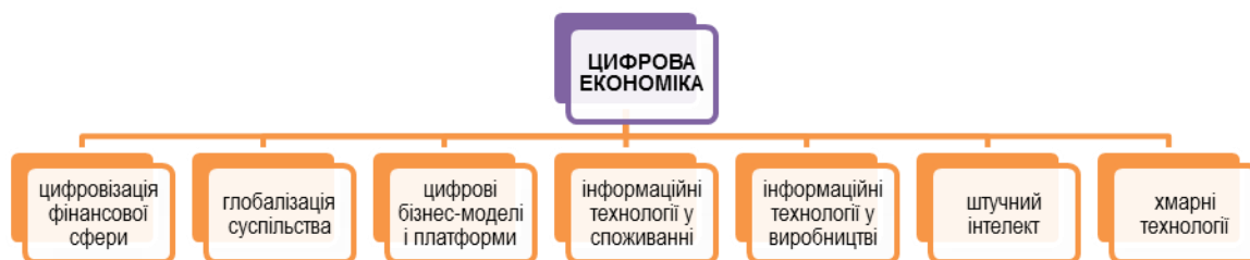
Рисунок 1. Загальні ознаки цифрової економіки

Вона використовує сучасні технології, такі як штучний інтелект, блокчейн, Інтернет-речей тощо, для покращення процесів у всіх сферах життя. Україна може навчатися від європейських країн і розвивати цифрові технології для підвищення продуктивності, впровадження електронного урядування, створення «розумних» міст та розвитку інноваційних стартапів. Європа активно використовує цифрові технології для підвищення ефективності своїх економічних секторів. Загальні ознаки цифрової економіки, які застосовують розвинені країни. (рис.1.)