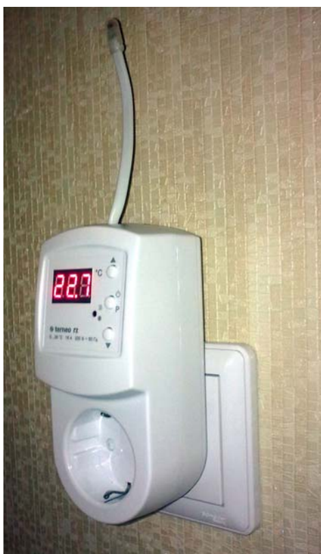
Рис. 5. Терморегулятор Terneo RZ із зовнішнім температурним датчиком