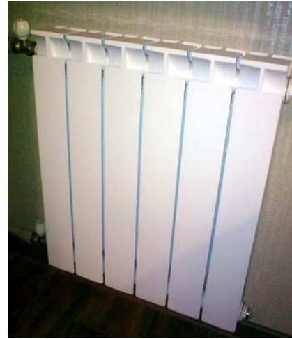
Рис. 3. Радіатор біметалевий 6-секційний

тість опалення 1 м 2 загальної площі становить 30,26 грн. Отже, у нашому випадку за місяць необхідно сплатити 30,26 \cdot 16 = 484,16 грн.