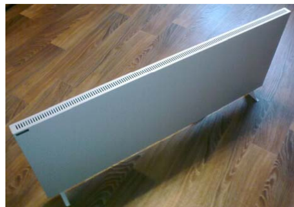
Рис. 4. Інфрачервоний конвекційний обігрівач TermoPlaza 700

Температура в приміщенні (+22 °С), що обігрівалось конвектором, автоматично підтримувалась на заданому рівні електронним терморегулятором Termo RZ із зовнішнім температурним датчиком (рис. 5).