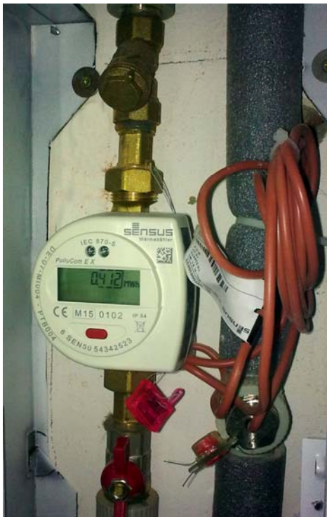
Рис. 2. Індивідуальний вузол обліку теплової енергії

Різниця показників теплового лічильника за добу склала 0,012 МВт. Температура теплоносія у вузлі обліку теплової енергії на вході та виході становила 49 °С і 40 °С відповідно. За формулою (1) отримано добове значення Q_c , що дорівнює 0,01032 Гкал. За розрахунковий період (30 днів) отримаємо Q_c , що дорівнює 0,3096 Гкал. Відповідно до тарифів, що встановлені для населення ПOKBПKГ «Полтава-теплоенерго» на послуги централізованого опалення (Постанова № 1101 від 09.06.2016 р. Національної комісії, що здійснює державне регулювання у сферах енергетики та комунальних послуг), вартість 1 Гкал становить 1350,66 грн. Отже, за місяць необхідно сплатити 1350,66 \cdot 0,3096 = 418,16 грн.