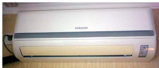
Рис. 7. Кондиціонер моделі Samsung AQ07UGFN

Недоліком даного джерела опалення є його обмеженість використання при від'ємних температурах.