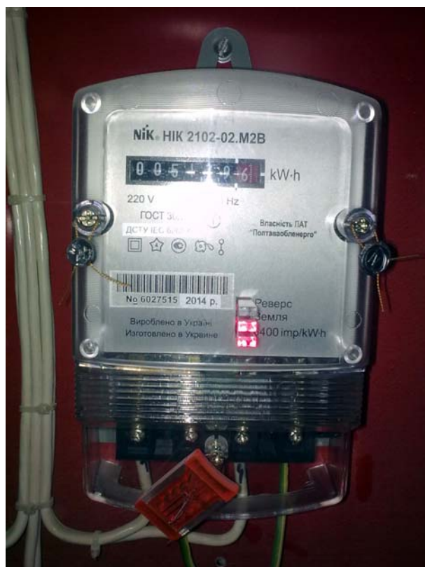
Рис. 6. Лічильник однофазний обліку спожитої електричної енергії НІК 2102-02.М2В

Вимірювання рівня спожитої електричної енергії здійснювалось за допомогою лічильника однофазного НІК 2102-02.М2В (рис. 6).