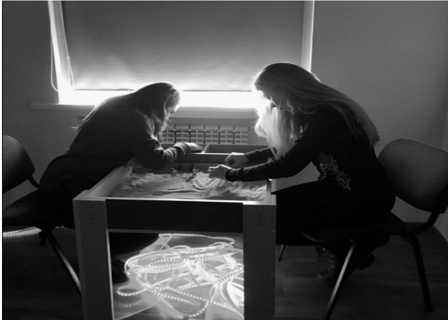
Рисунок 5. Пісочна терапія «Мої емоції», 2022 р.

Пропонуємо опис вправ для пісочної терапії, зокрема: