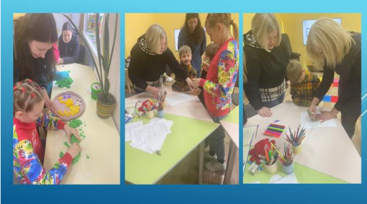
Рис. 1 Виконання арт-вправ на базі лабораторії психодіагностики та корекційно-розвивальної роботи НУ «Полтавська політехніка імені Юрія Кондратюка»