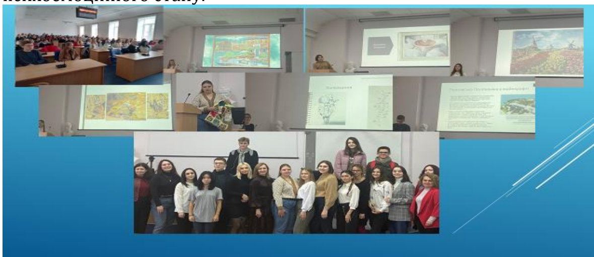
Рис. 4 Засідання психологічної студії «Шлях до успіху»

На засіданнях психологічної студії «Шлях до успіху» у студентів є можливість поділитися власним досвідом з гармонізації психоемоційного стану.