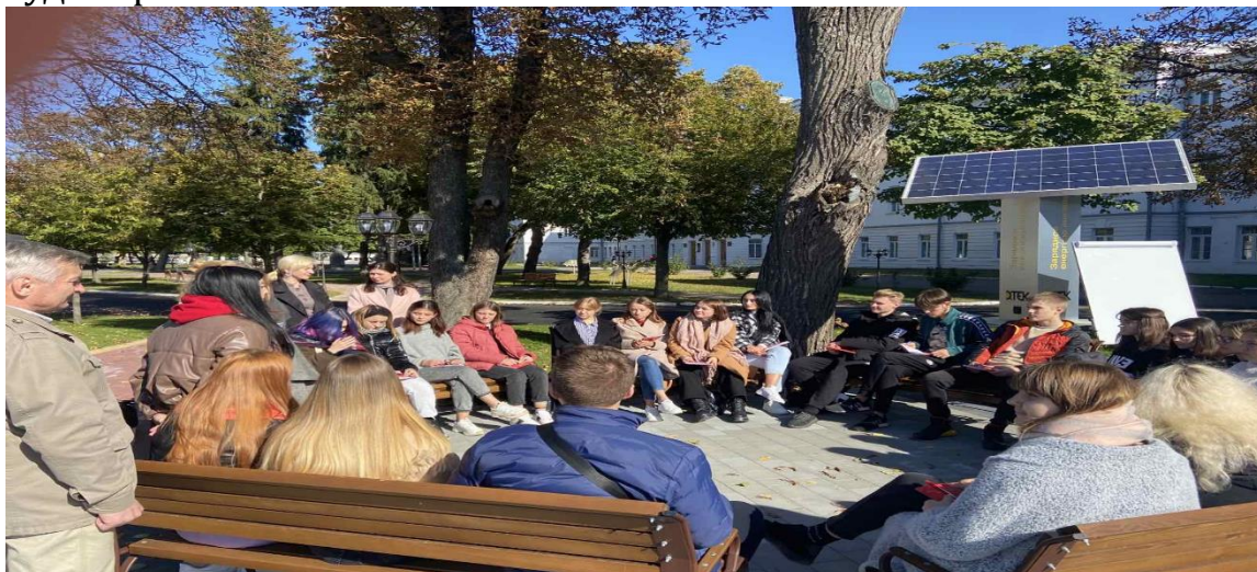
Рис. 3 Тренінгове заняття на алеї ДТЕК для студентів спеціальності 053 Психологія

можливість працювати зі здобувачами вищої освіти на території університету виконуючи ряд арт-екопрактик в «зелених аудиторіях».