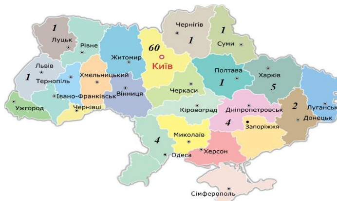
Рис. 2. Картограма неплатоспроможних комерційних банків по областях за 2014-початок 2016 років

На рис. 2 зображено кількість неплатоспроможних банків по областях.