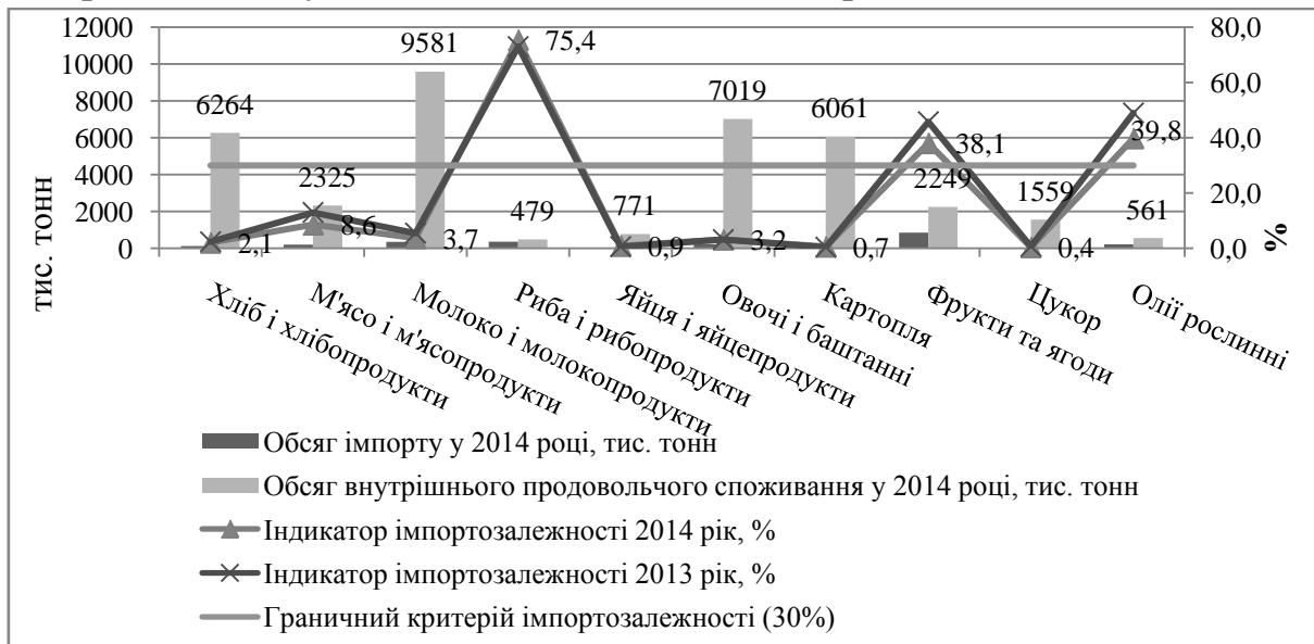
Рис.1. Індикатор продовольчої незалежності за групами продовольства у 2013 – 2014р*

Однак, незважаючи на те, що Україна значною мірою незалежна по ряду параметрів продовольства, є ряд проблем, серед яких найбільш вагомі пов'язані із технічним забезпеченням аграрного сектору, інвестиційними проектами, які впроваджуються у цій області, пріоритетними напрямками в зерновому господарстві, овочівництві й тваринництві, застарілістю виробничих потужностей переробних підприємств, закупівель необхідних засобів виробництва [1].