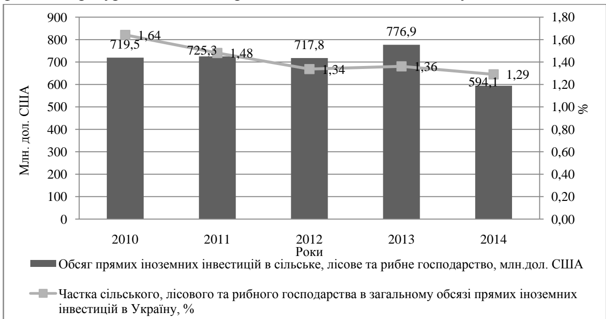
Рис.3. Динаміка прямих іноземних інвестицій в сільське, лісове та рибне господарство, млн. дол. США*

Обсяг прямих іноземних інвестицій в сільське господарство у 2014 році становив 594,1 млн. дол. США, що на 24% менше порівняно з 2013 роком, що може свідчити про зниження інвестиційної привабливості галузі для іноземних інвесторів (рис.3). Негативним є скорочення частки сільського господарства в загальному обсязі прямих іноземних інвестицій в Україну протягом 2010 – 2014 років, що свідчить про наявність більш привабливих галузей економіки (наприклад промисловість) в які інвестори готові вкладати фінансові ресурси з метою одержання інвестиційного доходу.