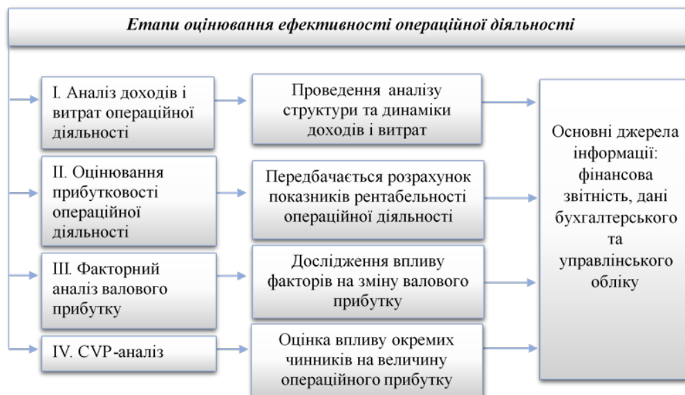
Рис. 1. Етапи оцінювання операційної діяльності підприємства