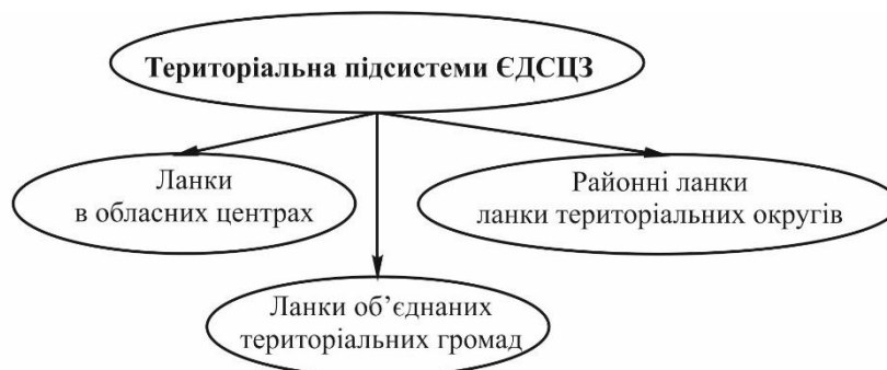
Рис. 1. Структура територіальної підсистеми єдиної державної системи цивільного захисту

Забезпечення реалізації державної політики у сфері цивільного захисту в межах області здійснюється територіальною підсистемою єдиної державної системи цивільного захисту, до складу якої, зокрема, входять ланки, що утворюються органами місцевого самоврядування (рис. 1.)