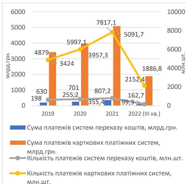
Рис. 2. Динаміка платежів та їх кількість, які були здійснені через системи переказу коштів та карткові платіжні системи протягом 2019–2022 рр.

Проте за кількістю здійснених платежів СЕП займає найменшу частку порівняно з системами переказу коштів та картковими платіжними системами. Так, за кількістю здійснених операцій в Україні на першому місці карткові платіжні системи – навіть незважаючи на їх зменшення до 2,15 млрд шт. на 01.10.2022 року з 7,82 млрд на початок року. Відповідно, й сума операцій, здійснених у карткових платіжних системах, за третій квартал 2022 року скоротилася порівняно з початком року на 62,9% до 1886,8 млрд грн (рис. 2).