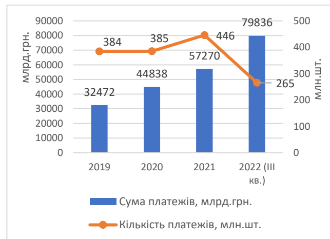
Рис. 1. Динаміка завантаження СЕП у 2019–2022 рр.

– за сумою найбільше платежів припадало на великі платежі. Зокрема, майже 98% склали платежі від 100 тис. грн і більше, 2% та 1% платежі від 1 тис. грн до 100 тис. грн та до 1 тис. грн, відповідно.