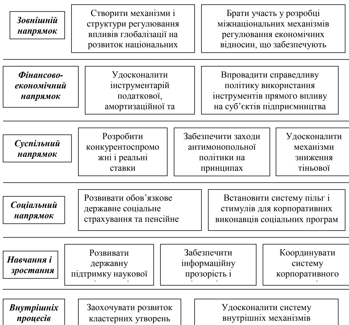
Рис. 3. Стратегічна карта державної регуляторної політики: авторська розробка.

Місія: сконцентрувати увагу на економічному розвитку регіонів і галузей національного господарства в умовах інтеграції до світового співтовариства та з урахуванням глобалізаційних процесів, підвищенні добробуту громадян