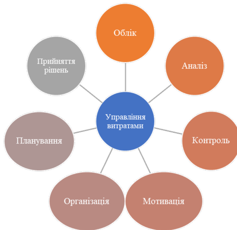
Рис.2. Елементи процесу управління витратами

Аналізуючи витрати підприємства, є можливість дослідити доцільність і раціональність їх здійснення та визначити фактори, які на них впливають, резерви зниження витрат та їх напрями оптимізації; забезпечити інформаційну базу для планування та прийняття рішень. Елементи процесу управління витратами (рис.2). Управління витратами тісно пов'язане з менеджментом та економікою, поєднує в собі риси операційного та фінансового менеджменту з метою оптимізації витрат та максимізації успішної діяльності українських бізнесменів [5]. В умовах економічної кризи досягнення бажаного ефекту при найменшому задіянні ресурсів підприємства залежить від обраних методів управління витратами, що являє їх зниження.