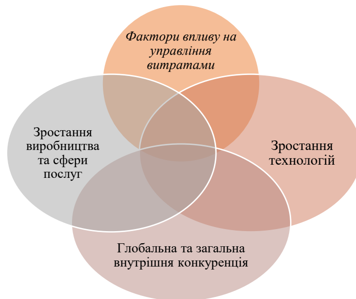
Рис.5. Фактори, які впливають на управління витратами