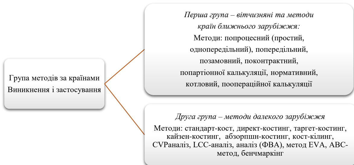
Рис.3. Групи наукових підходів до існуючих методів управління витратами

Дослідивши фахову літературу, можемо зазначити, що методики управління витратами підприємства можна поділити на дві групи: за країнами походження та застосування (рис.3)