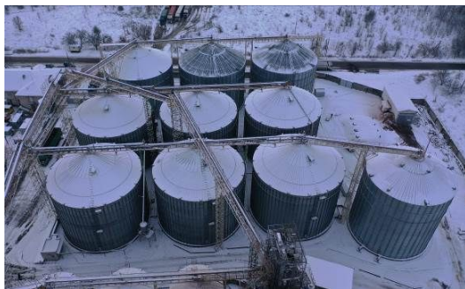
Рис. 1. Приклад елеватору з металевими силосами

На сьогодні найбільш поширеною технологією сушіння, зберігання й переробки зернових культур є використання елеваторів з металевими силосами (в т. ч. з конусним і плоским днищем), норіями, транспортерами, зерносушилками і т. ін. (рис. 1). Агропромисловість – одна з пріоритетних галузей України, а тому подальший попит на елеватори лише зростатиме, що й спостерігається останнім часом. Для таких конструкцій силосів найбільш відповідальними елементами є фундамент і металевий корпус (стінки й покрівля). Металевий корпус збірний, тому аварії з ним можливі лише за умови недотримання технологічних вимог при монтажі й експлуатації. Більшість ускладнень та аварійних ситуацій при експлуатації силосів викликано нерівномірними деформаціями ґрунтової основи та руйнуванням конструкцій фундаментів внаслідок таких деформацій.