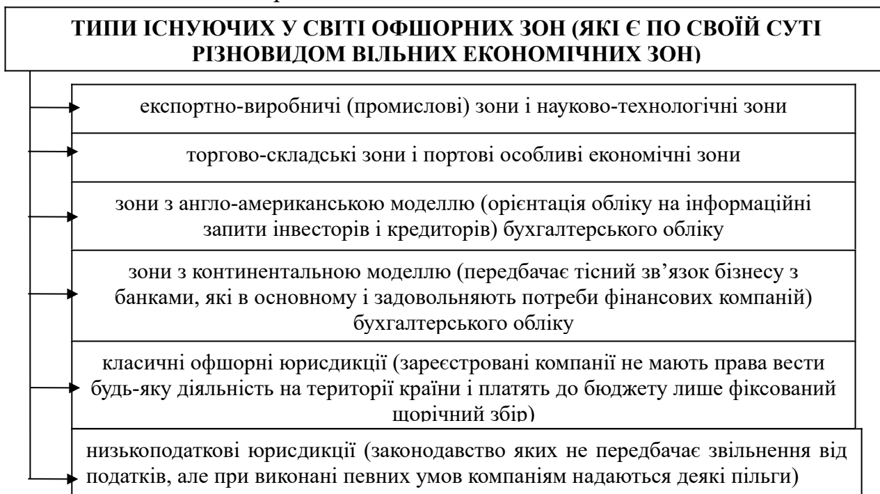
Рис. 9. Основні типи існуючих на сьогодні у світі офшорних зон

Таким чином, в Україні існують безліч проблем, котрі стримують економічний розвиток, загострюють загрози економічній безпеці та в цілому національній безпеці країни.