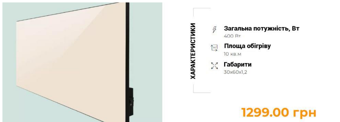
Рис. 2. Характеристики та вартість електроопалювального приладу

температури внутрішнього й зовнішнього повітря, умов розташування квартири (рядова, перший чи останній поверх).