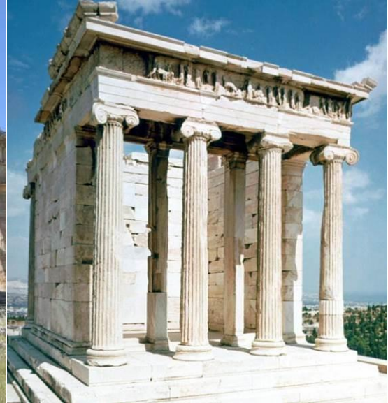
Рис.3 Іонічний ордер

В основі ордерної системи лежав саме антропологізм світогляду та світовідчуття античних греків. «Чоловекоподобіє» впливало на все античне надання відповідної форми, в якому втілювалося головне вихідне положення в світогляді – існування і взаємодія чоловічого і жіночого начала в природі і житті. Саме тому грецькі зодчі (вони ж скульптори) розробили в рамках єдиної стійко-балкової конструктивної системи два головних ордера: «чоловічий» – доричний і «жіночий» – іонічний.