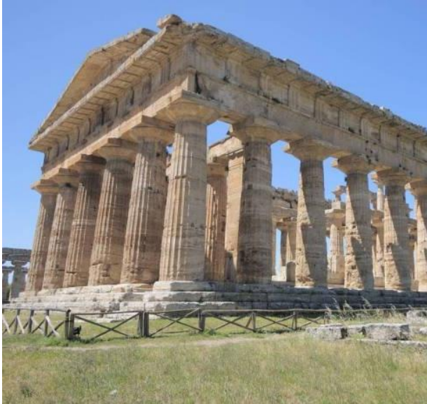
Рис. 2 Доричний ордер

Будівлею або спорудою можна викликати у людини відчуття тяжкості, масивності або, навпаки, легкості. Розглянемо на прикладі архітектурних ордерів античної Греції (Рис.2, Рис.3).