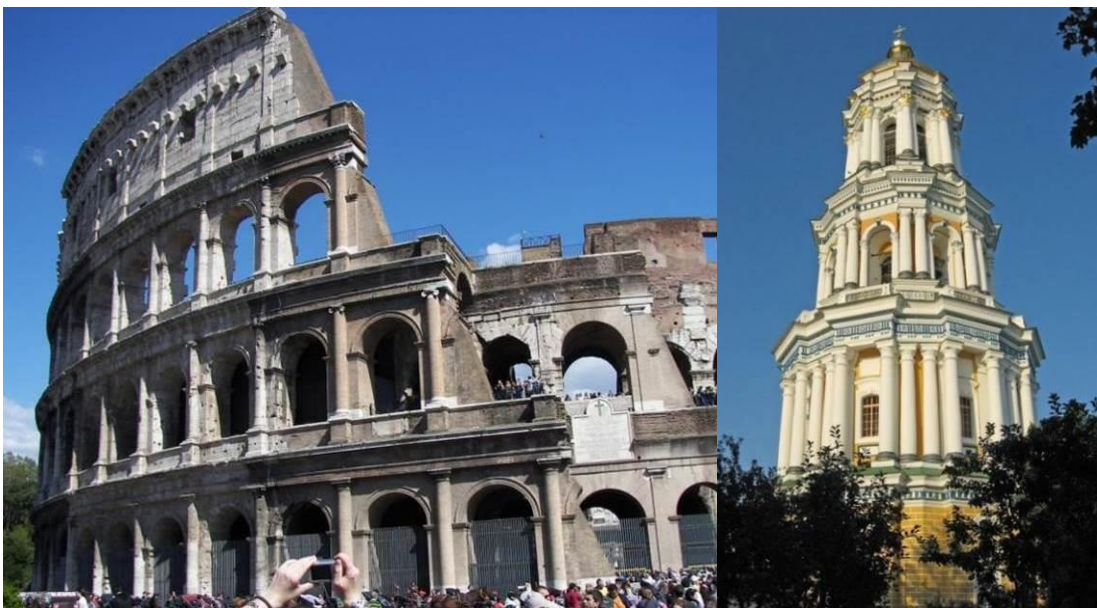
Рис.4. Колізей, м. Рим, Італія

Як я вже говорилося, контрастні грецьким були досліді тектонізма давньоримських зодчих, які лише прикрашали потужні стіни «накладними» арочними і ордерними елементами, не піклуючись про тектонічну правдивість результатів таких дослідів. Тому тектоніку римських споруд можна назвати образотворчою. Прикладом може слугувати найбільший амфітеатр Стародавнього Риму (Рис 4).