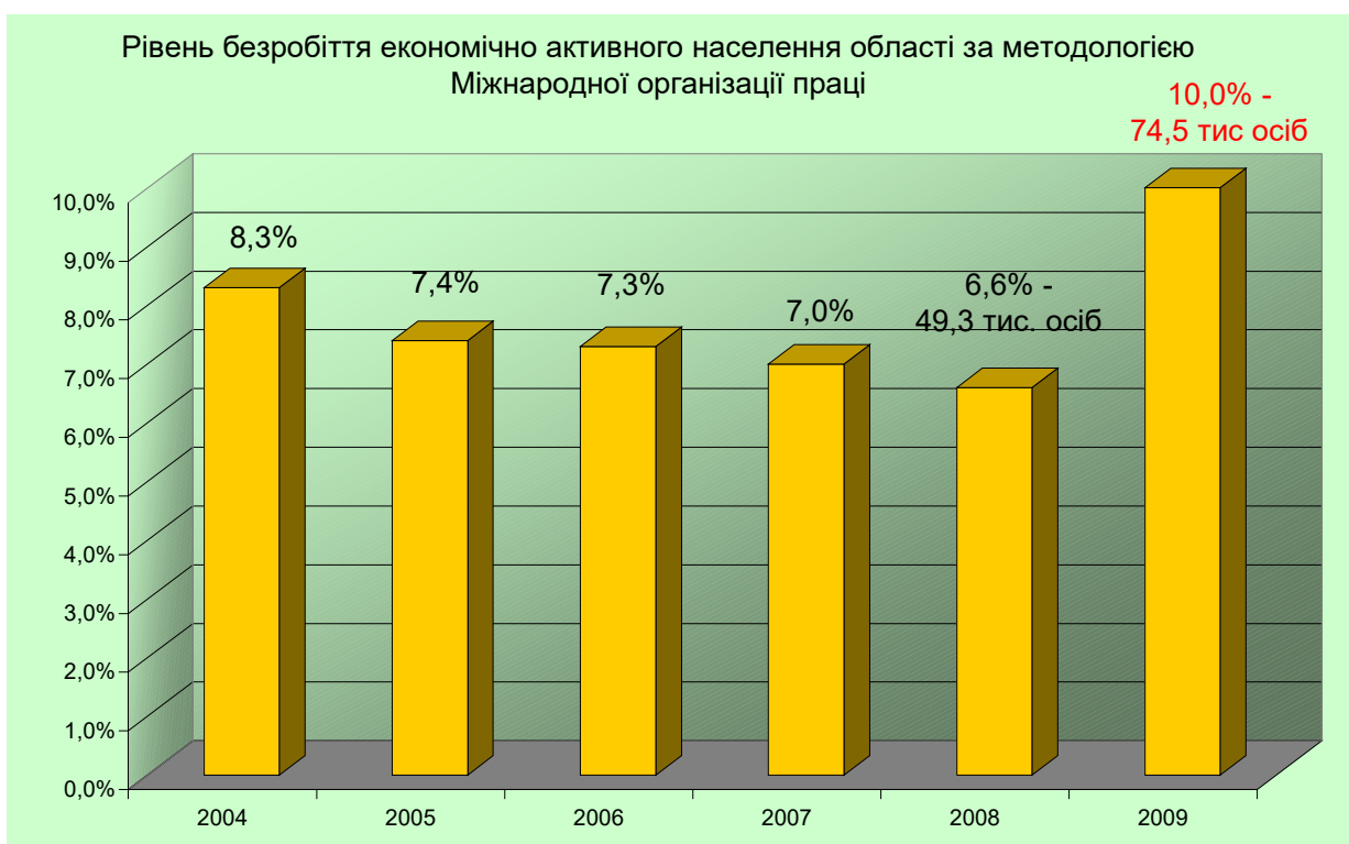
Рис. 3. Динаміка рівня безробіття економічно активного населення по Полтавській області за період 2004 – 2009 роки, розрахована за методологією Міжнародної організації праці.

На ринку праці фінансового сектору економіки регіону спостерігатимуться негативні тенденції. Так, аналіз впливу рівня безробіття на ситуацію на ринку праці Полтавської області показав, що 2009 році очікується майже 75 тисяч безробітних серед економічно активного населення області, проти 50 тисяч у першому півріччі 2008 року (рис.3). За прогнозами аналітиків, в умовах світової фінансової кризи, в найближчі два роки очікується суттєве скорочення робочих місць в усіх галузях економіки, особливо це торкнеться фінансового сектору.