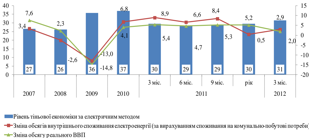
Рис. 2 Рівень тіньової економіки за електричним методом, у % до офіційного ВВП [2]

Враховуючи, що у 2012 році тривали процеси модернізації цієї сфери, спрямовані на зменшення втрат електроенергії, а також споживання палива, теплоенергії та електроенергії на технологічні потреби, – зростання обсягів капітальних інвестицій ВЕД «Виробництво та розподілення електроенергії, газу та води» у січні-березні 2012 року становило 28,9% (у січні-березні 2011 року – на 38,8%), – більш вірогідною є гіпотеза про зростання споживання електроенергії у тішовому виробництві.