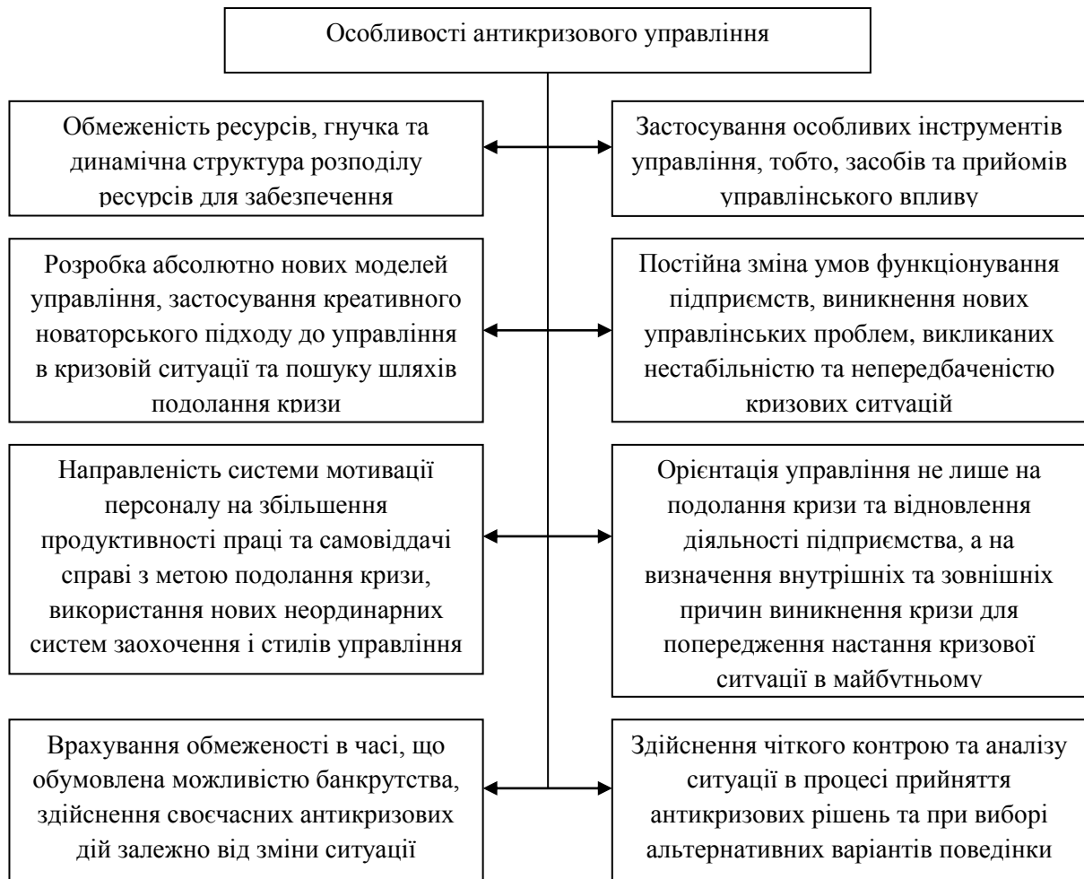
Рис. 2. Особливості антикризового управління

традиційного, та сприяють ефективному функціонуванню підприємства в умовах кризи (рис. 2).