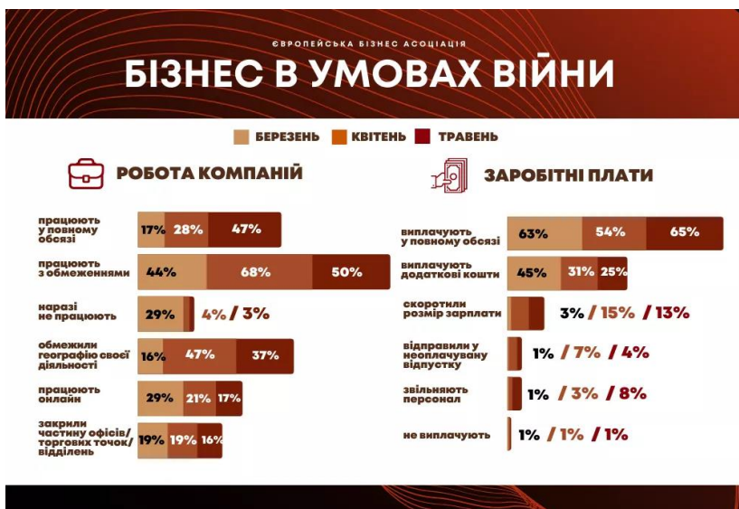
Рис. 2. Бізнес в умовах війни

Також гостро постає питання, на скільки вистачить резервів підприємців. Практично незмінною залишається оцінка бізнесом своїх фінансових резервів. Згідно статистики наведеної на офіційному сайті Дія (рис.2), третина компаній, а саме 34% оцінюють свою фінансову стійкість у 6 місяців, 20% вважають, що протримаються кілька місяців, решта 20% - рік, і ще 19% вистачить фінансових резервів на період понад рік.