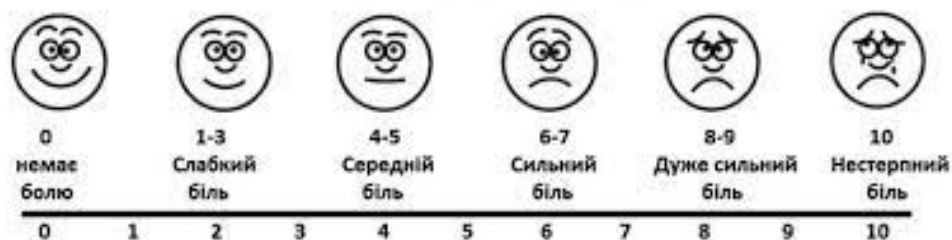
Рис. 1. «Візуально-аналогова шкала оцінки інтенсивності болю»

Пацієнту пропонувалося на прямій лінії довжиною 10 см (100 мм), поділеної на 10 позначень, відзначити рівень інтенсивності болю точкою: початкова точка позначає відсутність болю – 0, потім іде слабкий біль, помірний біль, сильний біль, і кінцева точка – нестерпний біль.