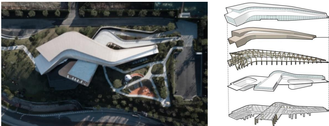
Рис. 1. Формування творчого молодіжного центру в Китаї [1]

Креативні простори для молоді поєднують культурну освіту та творчість, створюючи деякі містобудівні акценти (рис.1).