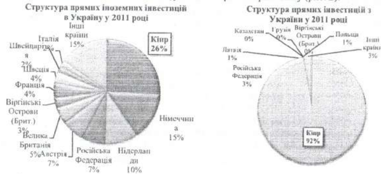
Рис. 2. Структура прямих іноземних інвестицій в Україну та зовнішніх інвестицій з України за окремими країнами світу у 2011 році

Оцінити масштабність фінансових потоків, які проходять поза бюджетом України, можна проаналізувавши співвідношення прямих іноземних інвестицій в Україну за країнами походження та зовнішніх інвестицій з України до окремих країн світу (рис. 2).