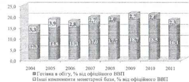
Рис. 1. Динаміка обсягу готівки в обігу по відношенню до ВВП у 2004 – 2011 рр.

У грошово-кредитній сфері одним із індикаторів рівня тінізації національної економіки є показник обсягу використання готівки у розрахунках по відношенню до офіційного ВВП та динаміка структури грошової бази в країні (рис. 1).