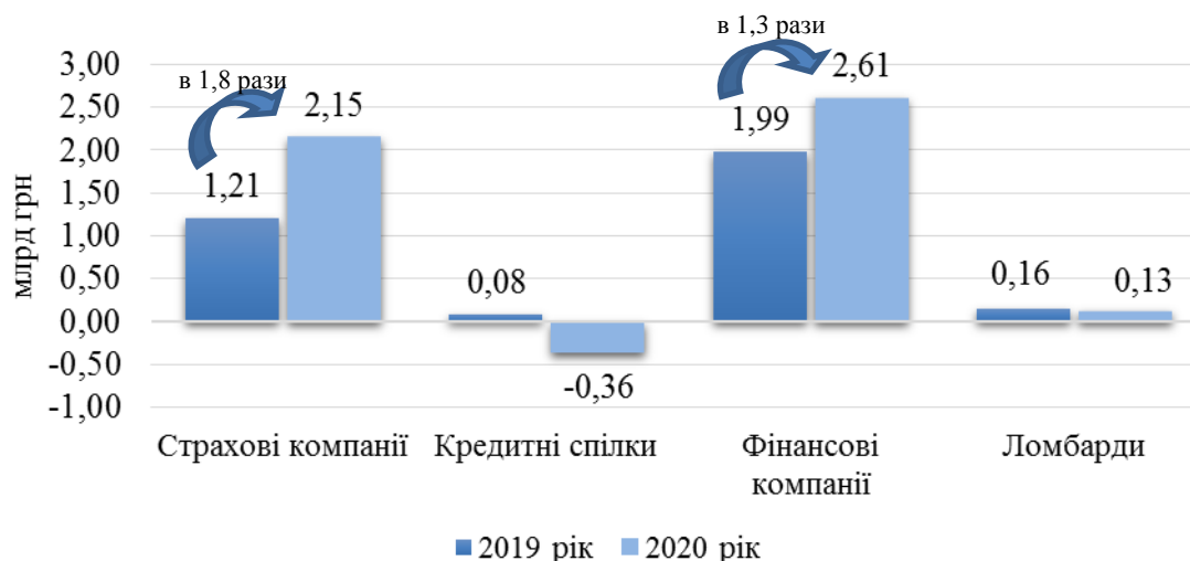
Рис. 1. Динаміка чистих фінансових результатів небанківських фінансових установ України протягом у 2019–2020 рр.

Підсумки роботи установ небанківського фінансового сектора протягом 2019–2020 рр. засвідчили стабільне зростання фінансових результатів страхових компаній в Україні, на відміну від решти його суб'єктів (рис. 1), що досягнуто за рахунок помірного зростання страхових премій, збереження сталих показників збитковості, а також уникнення знецінення активів. Так, чистий прибуток страховиків, незважаючи на кризу, зумовлену пандемією COVID-19, та скорочення кількості страхових компаній, які не виконали вимог регулятора, протягом 2020 року збільшився в 1,8 разу з 1,21 до 2,15 млрд грн.