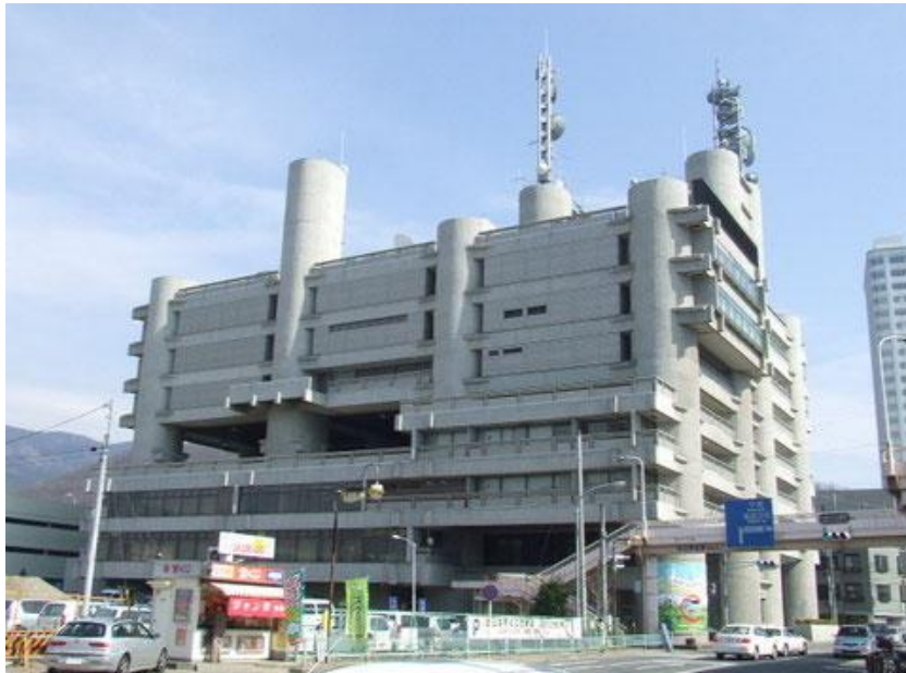
Рис. 5. Будівля префектури Яманасі – великий масштаб членувань

Розділяється він на великий і дрібний. Відповідно до нього форма може виглядати якої великої, монументальної, або дрібної, легкою. Крупним композиційним масштабом не обов'язково відрізняється велика форма. У великій формі часто вражає абсолютна величина – розмір, але не масштаб, співрозмірний людині. Вирішується вона в основному саме за рахунок членування форми. Крупний масштаб відносимо зі слабо розчленованої формою, невеликий – із сильно розчленованої формою.