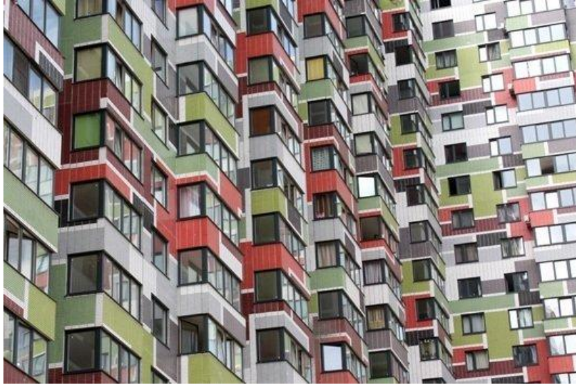
Рис. 6. Фрагмент фасаду житлового будинку – малий масштаб членувань

Масштабність в архітектурі, відображає соціально-історичні умови і світовідчуття тієї чи іншої епохи, суспільне становище, є поряд з тектонічно осмисленими формами одним з головних засобів, втілюють основний характер художнього образу в архітектурі, роблячи його зрозумілим і вражаючим.