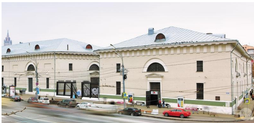
Рис. 4. Провіантські склади Жилярді