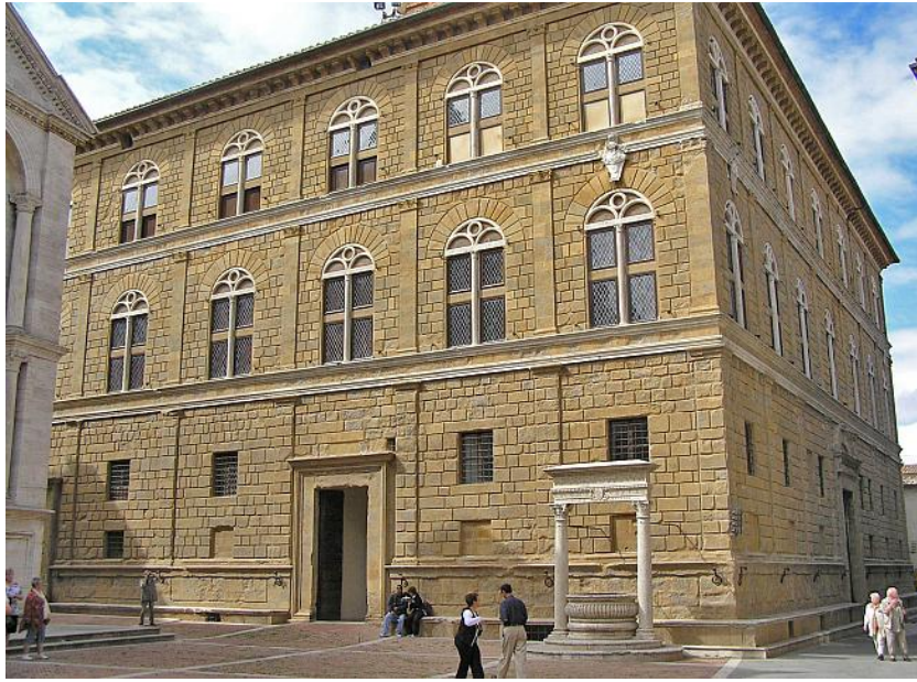
Рис. 2. Палаццо Пікколоміні в Пієнца