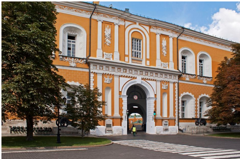
Рис. 3. Арсенал у Кремлі