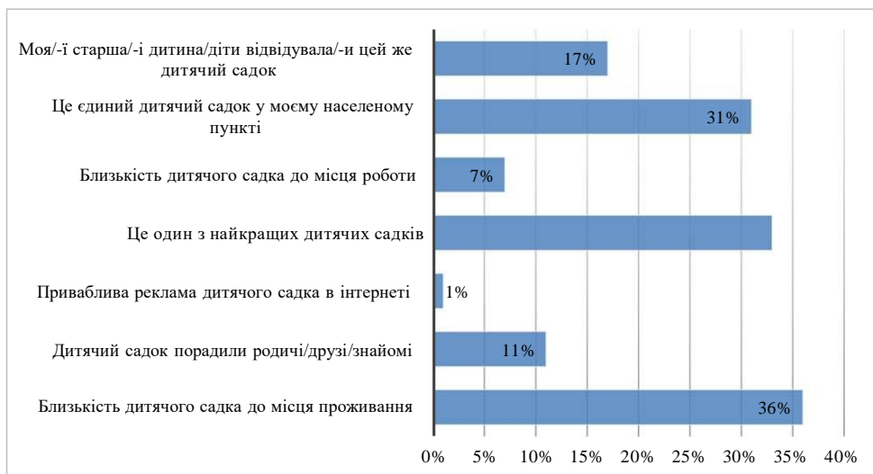
Рис. 2. Розподіл відповідей батьків (законних представників) дітей щодо причин вибору закладу дошкільної освіти

Виходячи з цього, до основних внутрішніх факторів, які приводять до зростання якості освітніх послуг, підвищення доходу та прибутку ПЗДО, ми відносимо покращення матеріально-технічного забезпечення та кваліфікації персоналу, високу якість харчування, наявність додаткових послуг (наприклад, збирання дітей із дому), графік роботи (наявність цілодобових груп), використання інноваційних технологій та сучасних методів навчання, покращення психологічного клімату та взаємодії із батьками.